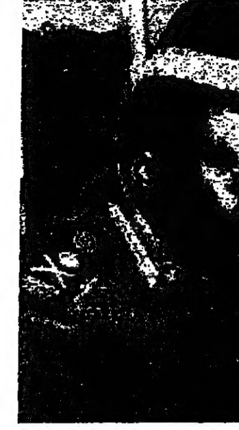
الرئيس عيدى امين

تلقته « وكالة الأنباء الفرنسية » امس ، لصالح الرئيس التونسي عيدى امين . وكان رئيس الوزراء البريطاني هرولد ويلسون قد بحث مسألة امس الاول ، برسالة الى الرئيس التونسي للاطلاع على « وجهة نظر » امين في العلاقات البريطانية الافريقية . اذا ما تم الحوار من المحاضر البريطاني دنيس هيلز ، الذي اهتم بالعلاقة العنصرية وحكم عليه بالامداح . وكان رئيس الوزراء الرئيس عيدى امين ان يجيب كالاتي وزير الخارجية على استفسار توجهه الى كيبلا بوجود ان يتكلم انه ان يتم امداح هيلز . وايضا ويلسون للجنرال امين بان مندا من الخبرات البريطاني على استعداد لتقديمه الى كيبلا كقضية مسألة فتح التبادل التي يطلبها الرئيس الافريقي للصحافة البريطانية التي تم توريدها لفرنسا .